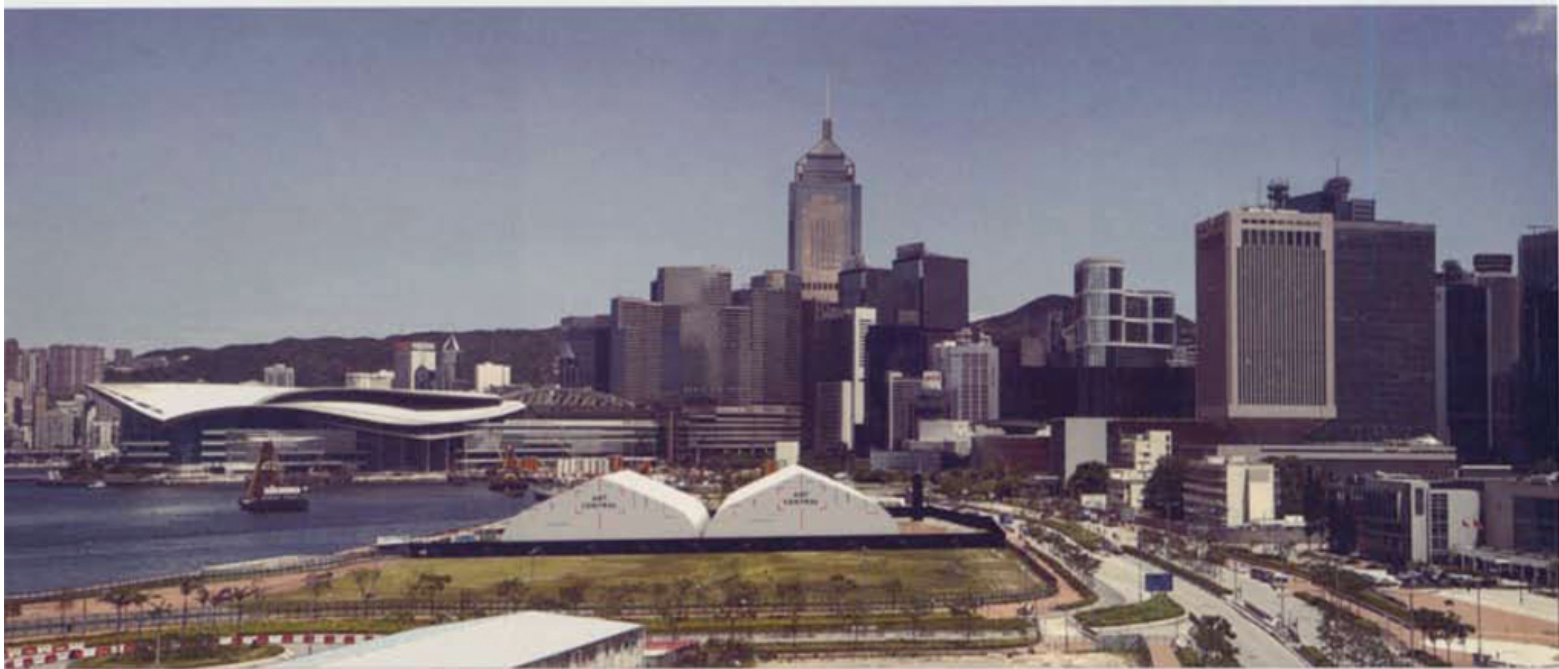
Art Central成為香港 首個衛星藝術展。